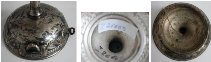
Detalii - înainte de restaurare

Toate metalele, în afară de aurul pur, vor coroda natural atunci când sunt expuse unor elemente cum ar fi aerul. Umiditatea relativă ridicată și poluanții atmosferici sunt cauze comune de coroziune a metalelor, inclusiv a argintului. Argintul este cunoscut ca un metal nobil, ceea ce înseamnă că este rezistent la coroziune, dar nu complet. Indiferent dacă este vorba de placare cu argint sau de argint pur, compozitul metalic va coroda atunci când este expus la aer și sulf.