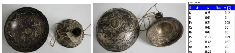
Cupă, nr. inv. I 26674, înainte de restaurare, determinări de compoziție