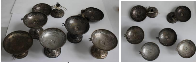
Înainte de restaurare

Obiectele erau acoperite cu un strat de compuși de coroziune de grosime, întindere și compoziție variabil, în funcție de microclimat, utilizare și compoziția/structura metalului, respectiv produși de coroziune de culoare negru, specifici argintului (sulfură de argint) și de culoare verde, pe partea interioară, specifici cuprului din aliaj, respectiv carbonați, oxizi, prezentau uzură funcțională, zgârieturi iar două piese aveau piciorul desprins de cupă.