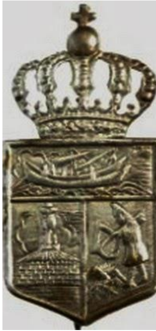
Emblema de pe epoleți a Batalionului 4 Grăniceresc de Gardă Akadâlnar