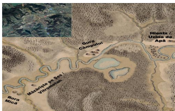
Epoca Neolitică și Eneolitică

Teritoriul municipiului Mediaș și zonele adiacente acestuia au reprezentat zone intens populate încă din cele mai vechi timpuri. Dovezi ale acestei realități o constituie în primul rând multitudinea fragmentelor ceramice, tezaurelor monetare sau descoperirii diferitelor artefacte arheologice databile în perioade istorice anterioare celei romane 2 . Primele epoci atestate în mod cert sunt: neoliticul și eneoliticul (cca. 7500 - 2000 î.H.), perioade care au fost înțelese drept un nou mod de viață în care omul a devenit producător, nemişcându-se doar cu statutul desuet de prădător (vezi imaginea de mai jos 3 ).